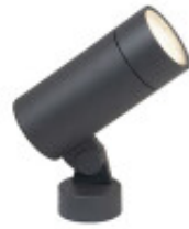
IMAGEN NO DISPONIBLE

Esta luminaria tiene proteccion IP65, es resistente al agua y la intemperie. Por esto es un artefacto ideal para la iluminación de espacios exteriores. Se instala adosada al piso, conectada a la corriente a 220V.